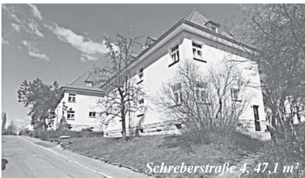
Schreiberstraße 4, 47,1 m 2